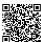
「関西ゴルフ振興」 ホームページ (モバイル版)